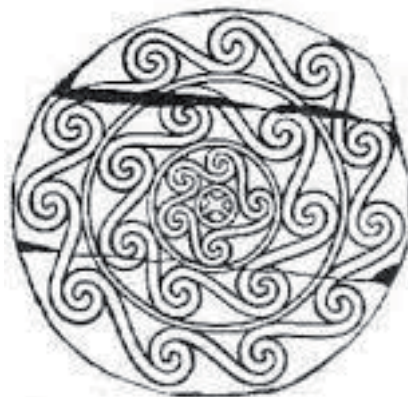
Kelemeszi szkíta korong