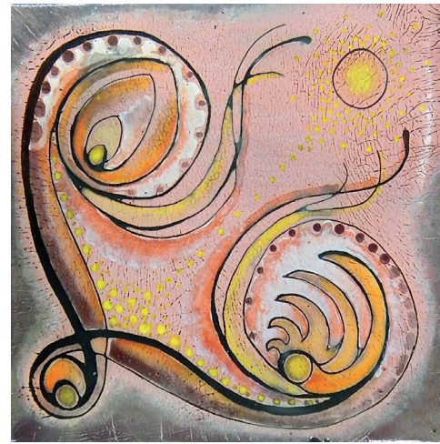
Nagy Márta tűzzománc képe DEMKI • Tájoló tűzzománc szakkör