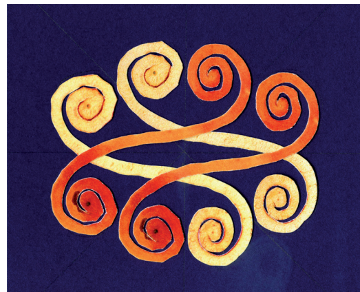
Alá- fölérendelő viszonyt modellező alakzat.