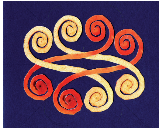
Mellérendelő viszonyt modellező alakzat. Kos-mérleg jel.