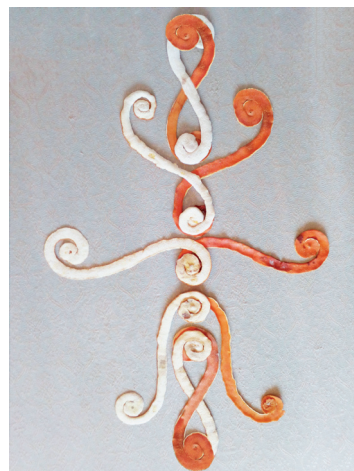
Út a végtelen jeltől a végtelen jelig. Nyitás, forgás, zárás alakzatok