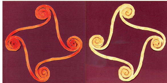
A kettős forgás alakok zárt teret alkotnak.